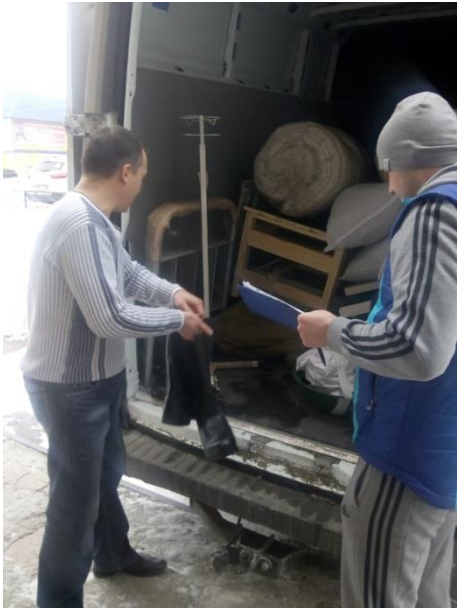
Получение оборудования в г. Серове