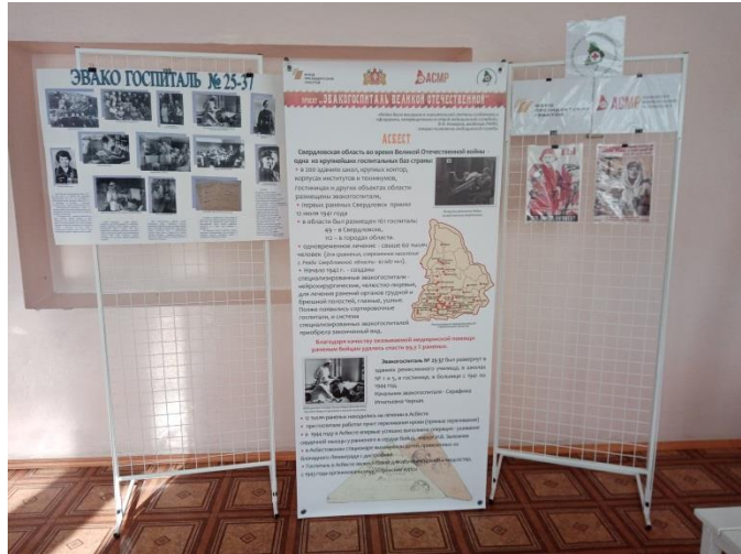
Стационарная реконструкция Эвакогоспиталя №25-37 в г. Асбесте