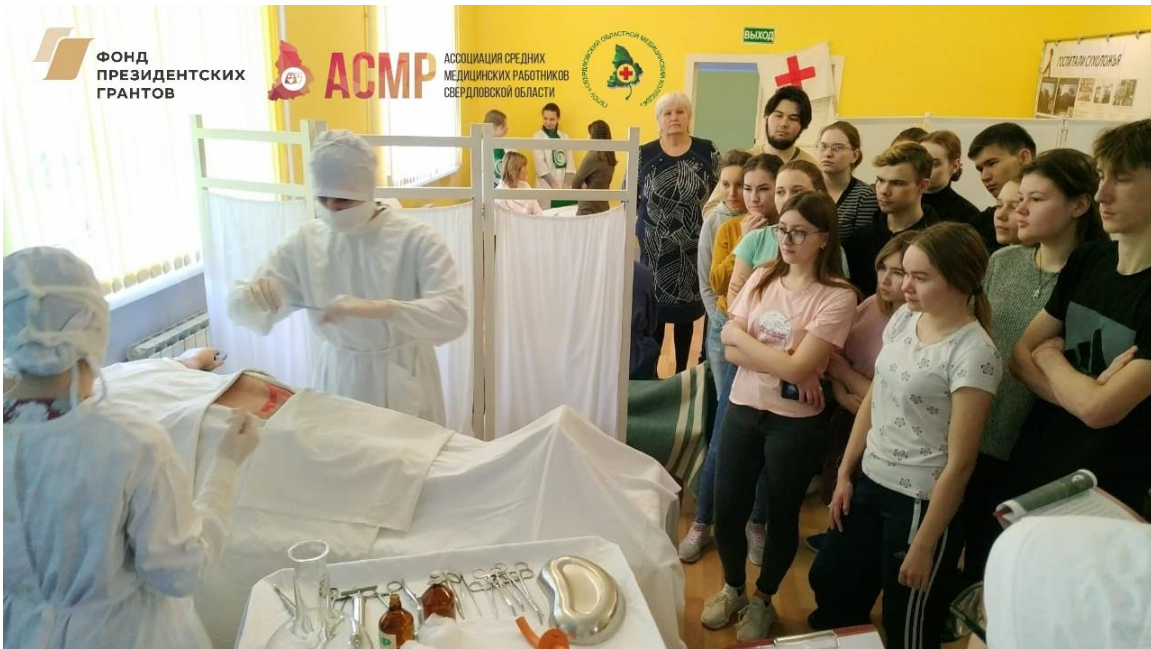
Стационарная реконструкция в г. Сухой Лог