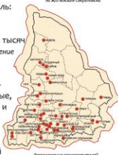
Распределение госпиталей по территории Свердловской области

Благодаря качеству оказываемой медицинской помощи раненым бойцам удалось спасти 99,3 % раненых.