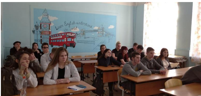
Обучение волонтеров г. Алапаевск