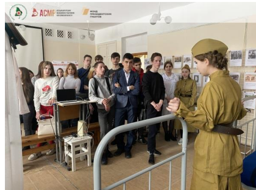
Стационарная экспозиция г. Нижний Тагил