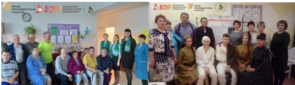
Участники экспозиции в г. Ирбите