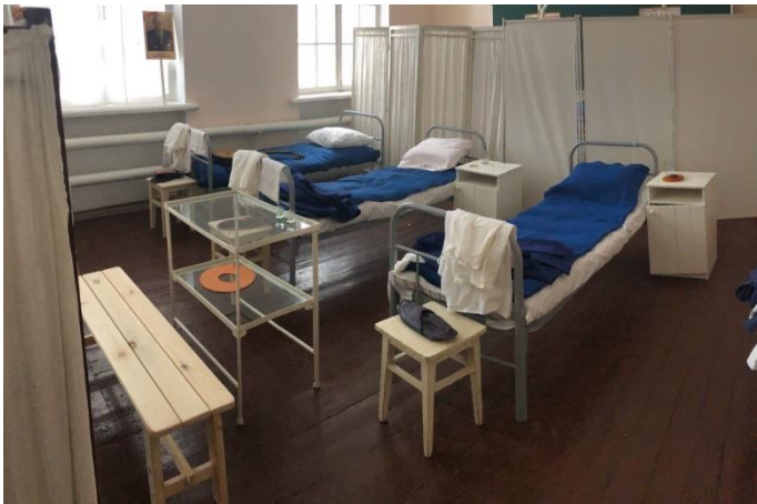
Подготовка стационарной экспозиции, г. Каменск-Уральский