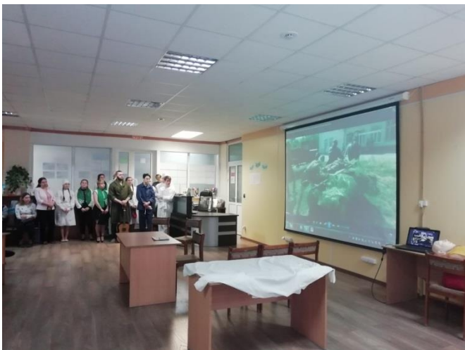
Развертывание реконструкции Эвакогоспиталя г. Ревда Выездная экспозиция